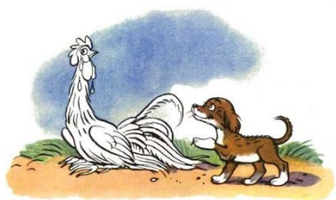
Петух, собака, лиса

Однажды собака и петух обиделись на своих хозяев.